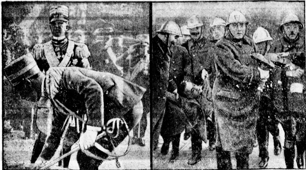
Umbertó trónörökös a sikertelen merénylet után elhelyezi a koszorút az ismeretlen Katona sírjára.