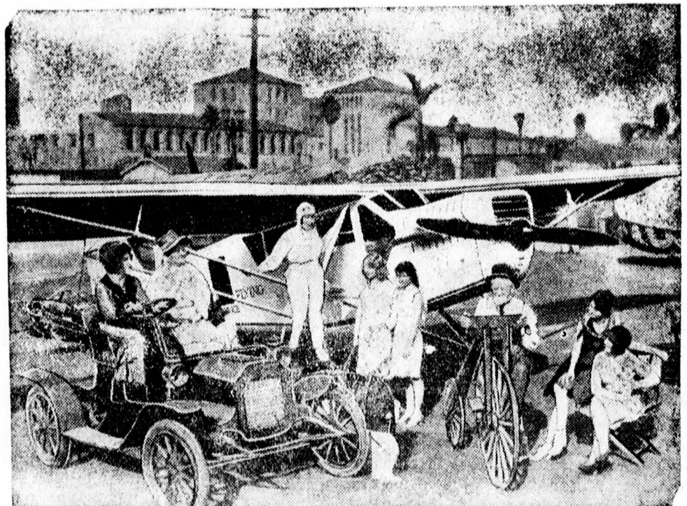
Kép egy Los Angelesben rendezett kedélyes kiállításról, ahol az első kerékpártól és első automobiltól a legmodernebb repülőgépig minden közlekedési eszközt bemutattak