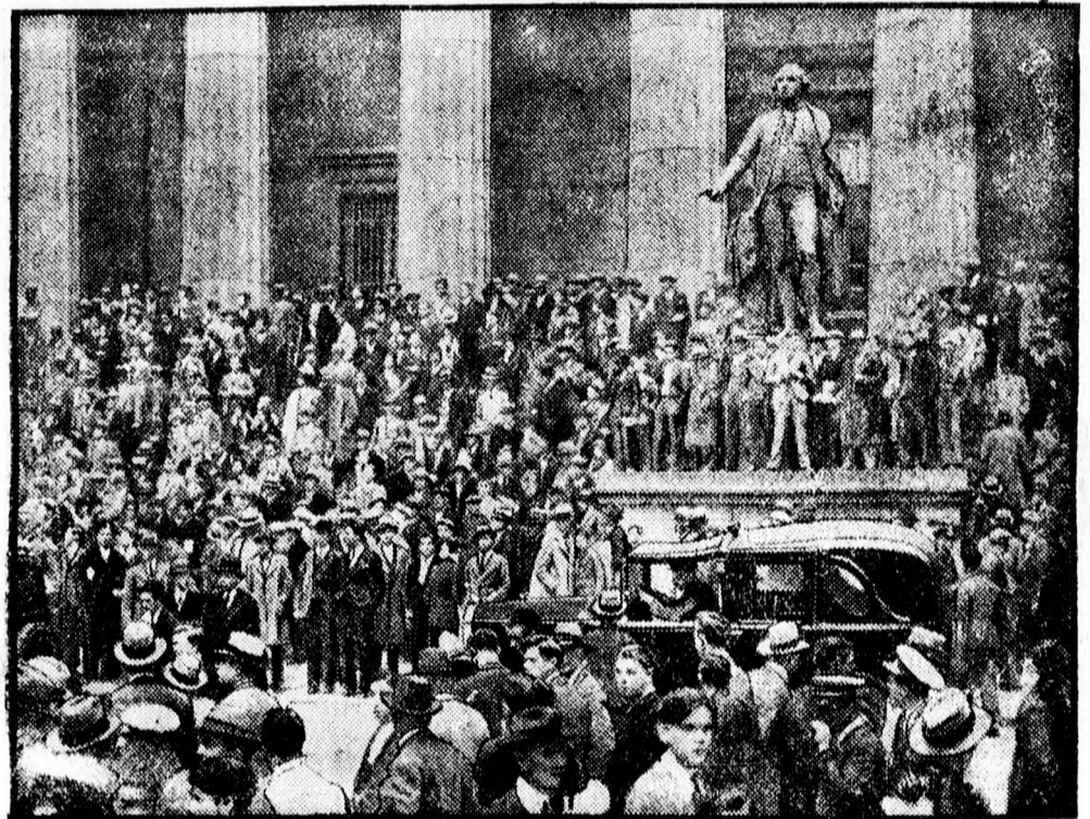
Igy festett az ucca a newyorki tőzsde előtt a mult héten, amikor a részvények árfolyam esése következtében tulajdonosaik sok milliárd dollárt vesztek