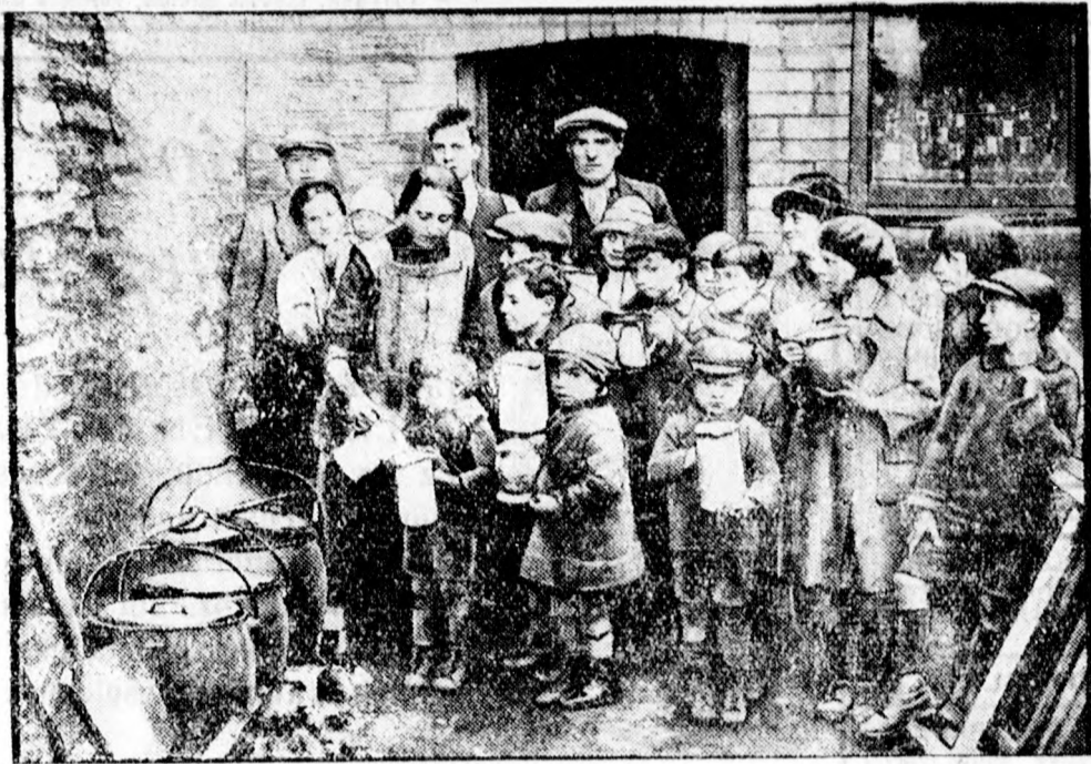
Az angliai, dél-walesi árvíz súlyos helyzetbe hozta a lakosságot. A nagy inségen jótékony egyesületek segítenek és élelmiszereket osztanak ki a szegények között.