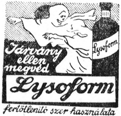
fertőtlenítő szer használatára

Erthető érdeklődéssel várja tehát Temerin katolikusága a főispáni döntést, amely után a kántori állás betöltésének ideje is elérkezik.