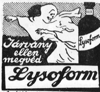
fertőtlenítő szer használata

A rendőrség egyébként vizsgálatot indított a tragikus ügyben. Tegnap délután, amikor az inas visszanyerte öntudatát, részletesen kihallgatták a szerencsétlenség lefolyására vonatkozólag.