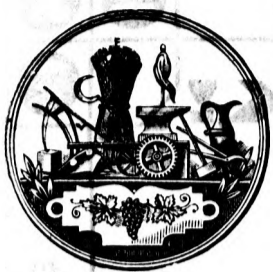
Nagy arany érem.