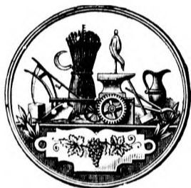
Nagy arany érem.

Bővebbet a falragaszok és a helybeli lapok.