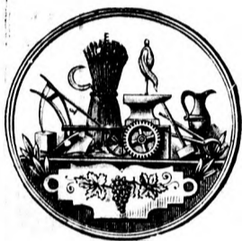
Nagy arany érem.

Az adai m. kir. földmivesiskola igazgatósága