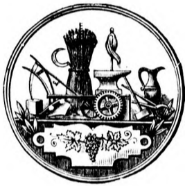
Nagy arany érem.