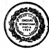
Nagy arany érem.