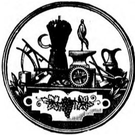
Nagy arany érem.