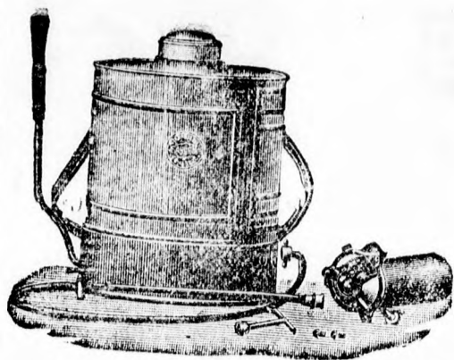
Az idén vörösrézről nem szabad