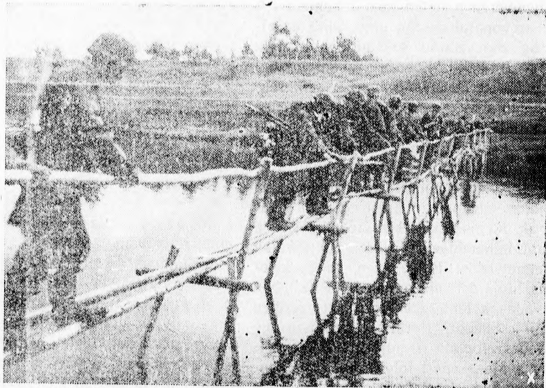
Lémet SS csapat keleten (Tek.)

HORTHY-ÜNNEPSÉGEK ZENTÁN. A DMKSz zentai szervezete a városi ható- sággal együtt szép ünnepi műsort ké- szített elő a Kormányzó Úr nevenap- jának megünneplésére.