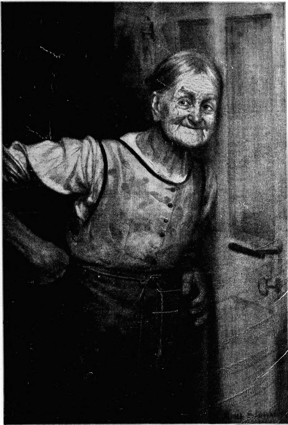
Schadenfreude. Nach einem Gemälde von Emil Schwabe.

Neuere Bilder. — Der an einer Lungenentzündung verstor-