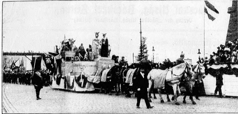
Gruppe „Hamburgs Handel und Schifffahrt“ aus dem Festzug anlässlich des XVI. Deutschen Bundesfestes in Hamburg. (S. 131)

In grauer Einsamkeit waren nach Elisabeths Scheiden Römers Tage dahingezogen. Der unbeugsame Mann glaubte den Schlag nimmer verwunden zu können, der ihn getroffen. Dennoch war er mehr als einmal auf dem Punkte, die Verstoßene, die all sein Glück ausgemacht, bei der sein Herz war, wo immer sie auch weilen mochte, zurückzurufen, ungeachtet aller Einwendungen, die