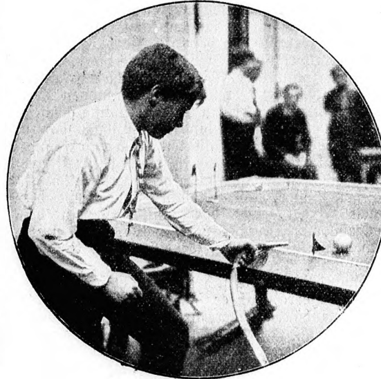
Das Luftbillard, ein neues Zimmerspiel. (S. 19) Nach einer Photographie von H. Kester in Berlin-Friedenau.

Als aber der Dantee eine Viertelstunde später zurückkam, fand er zu seiner Überraschung den Pastor bereits vollständig angekleidet und frisiert.