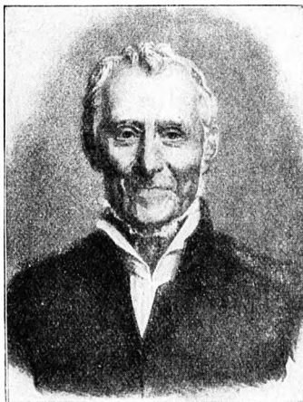
Ernst Moritz Arndt. (S. 18)

„Ja, zum ersten Male,“ bestätigte Emanuel Leutemann mit einem Seufzer, der deutlich verriet, wie wenig wohl ihm zurzeit noch bei seinem großen Unternehmen war. „Es wird wohl auch