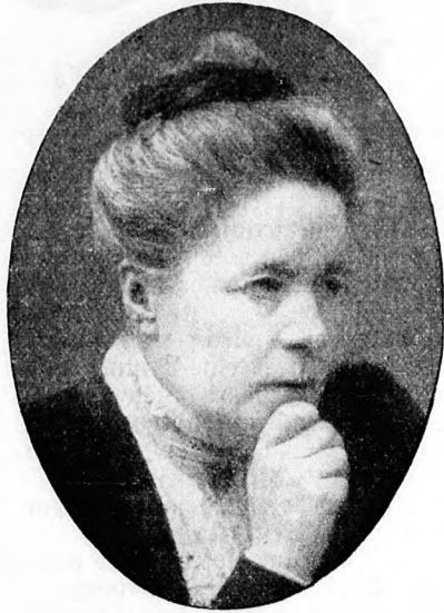
Selma Lagerlöf. (S. 19)

Dinsmore, der eben vor dem kleinen Spiegel seine gelockerte Krawatte aufs neue knüpfte, begnügte sich mit einem Achselzucken. Für ihn bedeutete die Reise nach Amerika offenbar ebensowenig eine nennenswerte Unbequemlichkeit, als er sich vor irgendwelchen Gefahren fürchtete. Die Ge-