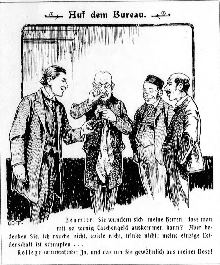
Auf dem Bureau. Beamter: Sie wundern sich, meine Herren, dass man mit so wenig Caschgeld auskommen kann? Aber bedenken Sie, ich rauche nicht, spiele nicht, trinke nicht; meine einzige Leidenschaft ist schnupfen... Kollege (unterbrechend): Ja, und das tun Sie gewöhnlich aus meiner Dose!

Eine schöne Antwort erteilte einmal der Humorist Saphir an zwei Abonnementen, die fragten: „Wir streiten uns, ob es heißt: Ich habe Ihnen gewunken, oder ich habe Ihnen gewinkt.“ Seine Antwort lautete: „Weil gar zu schön im Glas der Wein gebunken, hat sich der Hans dieblich getrinkt: Drauf ist im Zickzack er nach Hans gehunken Und seiner Greta an den Arm gefinkt. Die aber hat ganz zornig abgewartet Und hinter ihm die Türe zugeltunken.“ [C. I.]