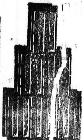
Szabadalmazott Bohn féle természetes vörös fedél-cserép.