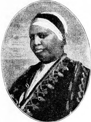
Taitu, Kaiserin von Abessinien. (S. 68)

Im Musikpavillon spielte die Kapelle eben „Erinnerungen an Taunhäuser“, eine von jenen Transkriptionen fünfklavierter Komponisten, die, unfähig, Eigenes zu erfinden, eine Anzahl Me-