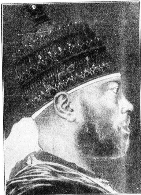
Menelik II., Kaiser von Abessinien. (S. 68)

Der Oberleutnant hatte es so einzurichten gewußt, daß er den beiden jungen Damen gegenüber Platz nehmen konnte, und pußte, während er dem Kellner in herablassendem Ton seine Bestellung aufgab, mit dem weißfeidenen, bunigeränderten Taschentuch gelegentlich sein Monotel.