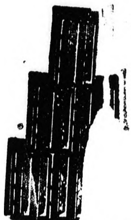
Szabadalmazott Bohn féle természetes vörös fedél-cserép.