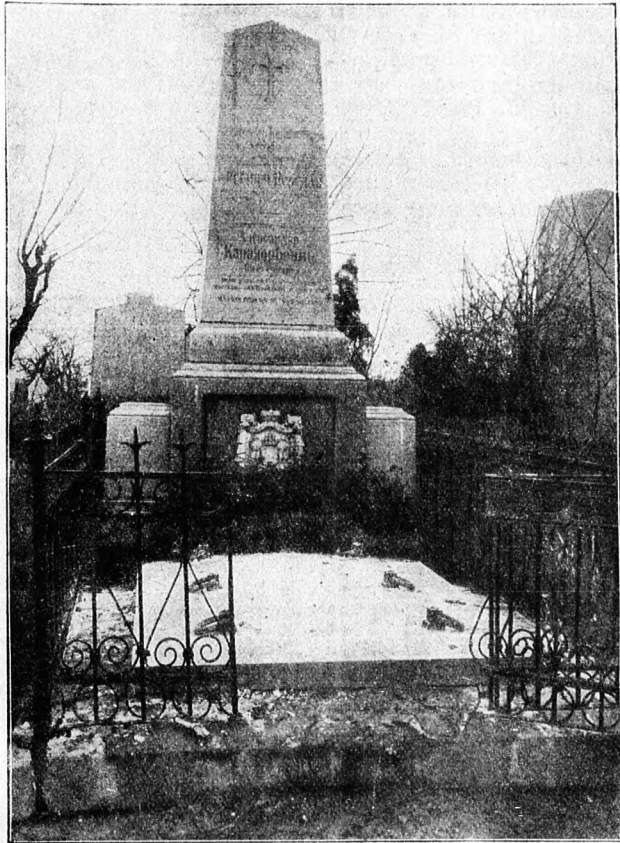
Die Gruft der fürstlichen Familie Karageorgewitsch auf dem St. Marger Friedhof in Wien. (S. 24)

Dann gab es noch einen Streit darüber, ob die Sache schriftlich abgemacht werden sollte oder nicht. Körber hatte eine dunkle Ahnung, daß man solche Sachen vor einem Notar abmachen müsse,