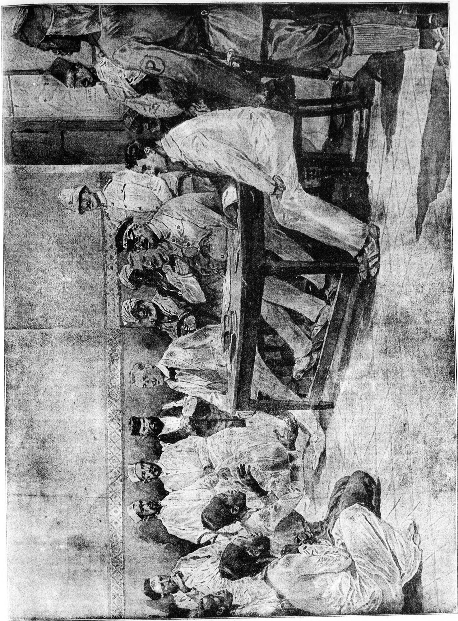
Eine Gerichtsverhandlung in Deutsch-Südafrika. (S. 24)

helfen. „I tut!“ „Gätte ig nicht o wäre vieriger e nur, hundert Nun, immer ihn zu auch ein belt es s Glück und da r Rüd-