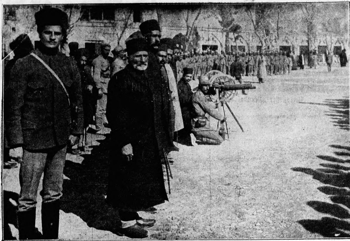
Perfische Gebirgsbatterie. (S. 24)

anderen aus der Not zu helfen. „Was doch der Zufall tut!“ sagte er sich dabei. „Hätte mir die Tante den Ring nicht in die Tasche gesteckt, so wäre die Sache weit schwieriger geworden. Ich hoffe nur, ich bekomme die elfhundert Mark auf den Ring. Nun, im Notfall bleibt mir immer noch die Möglichkeit, ihn zu verkaufen. Wenn er auch ein Andenken ist, so handelt es sich hier doch um das Glück zweier Menschen, und da müssen alle anderen Rücksichten schwinden.“