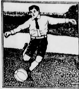
JAK B. Topola - Bezdán SK 4:1