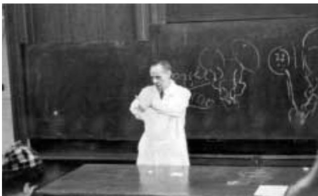
Maga miatt akár meg is halhat, magát az sem érdekli

sen megnézni. Utána üres kézzel jött vissza, és közölte, hogy a „Prof.” az albumot „elkobozta”. Azt hittem névtelen maradtam, míg néhány hónap múltán a 48-as téren este, hátam mögött egy ismerős hang: „Fotózunk mester?” – Ő volt. – Igen, fotózunk professzor úr és most ismét engedély nélkül itt vannak a soha meg nem ismétlődő pillanatok, ahogy professzor úr mondta: „Ars longa, vita brevis est”.