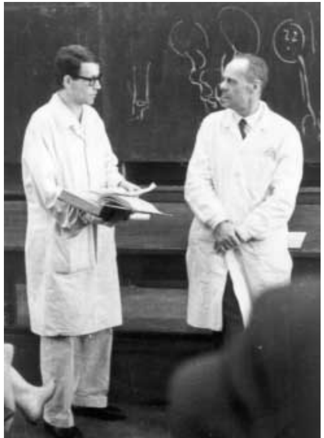
Őrület..., ne mondja...