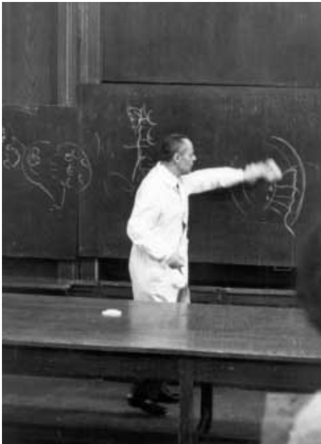
Ezt csak én törölhetem le (amit ő rajzolt, azt más nem törölhette le)