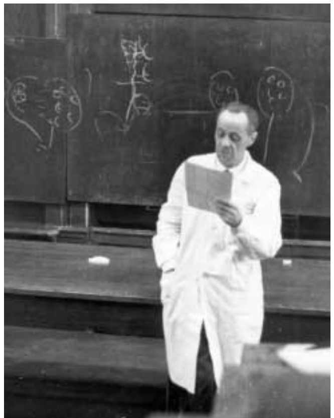
Hm... Polycystas vese... uraemia... hm...