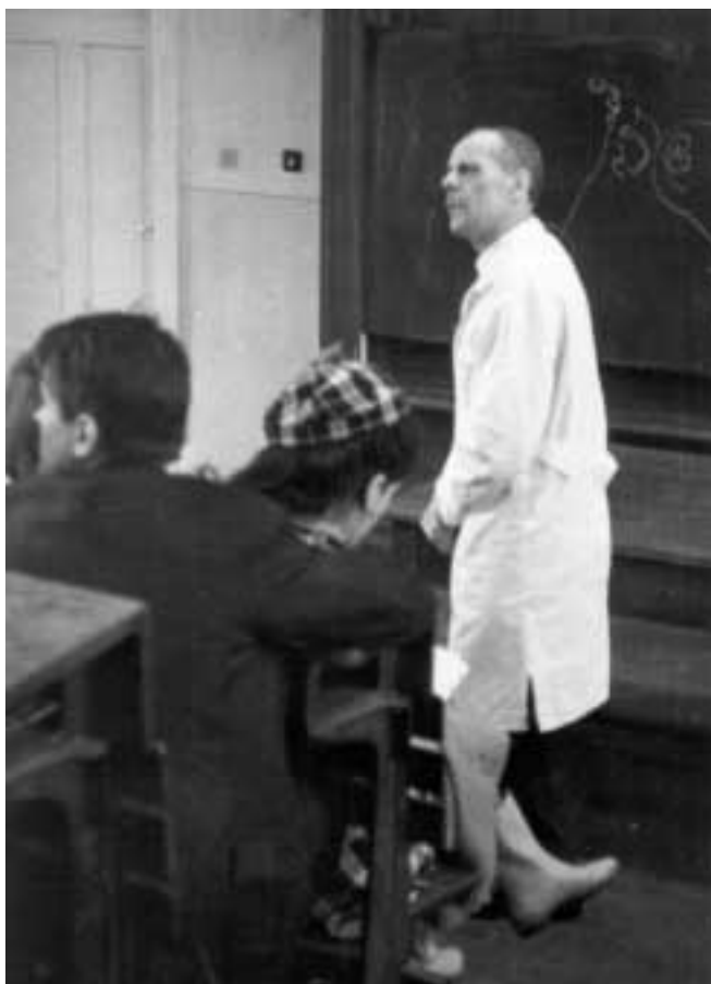
Persze, magát ez nem érdekli

A mellékelt felvételeket abból a sorozatomból válogattam, melyet Pécssett a POTE Dischka Győző utcai Kórbonctani Intézet előadótermében 1969. április 11-én, engedély nélkül, lopva, természetesen vaku nélkül, WERRA IV. típusú fényképezőgéppel