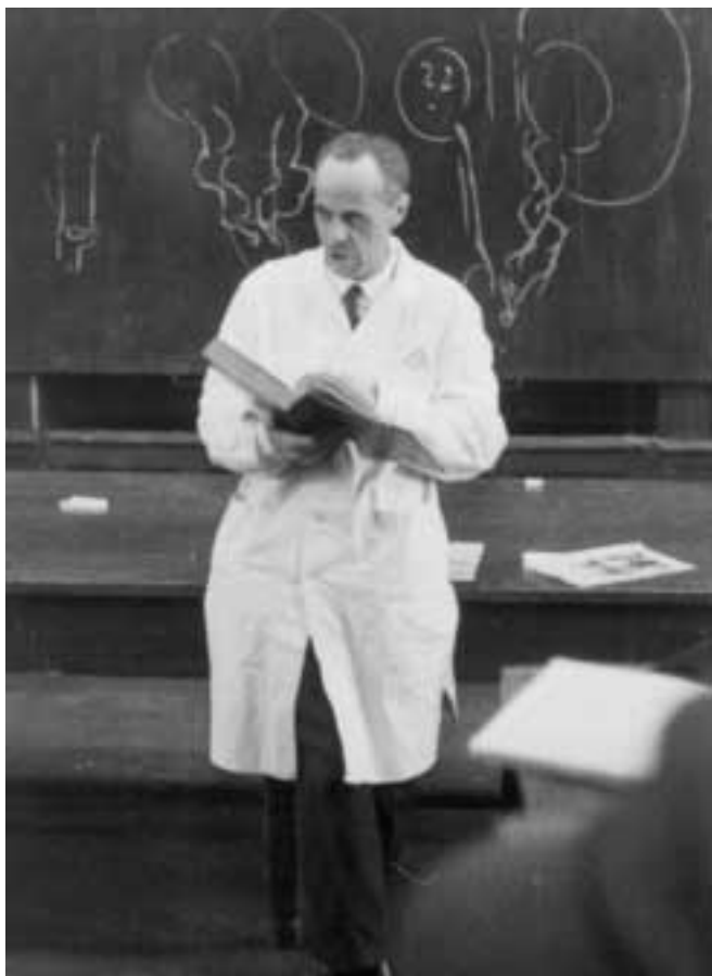
Figyeli?!? Meg kell ijedni!!!