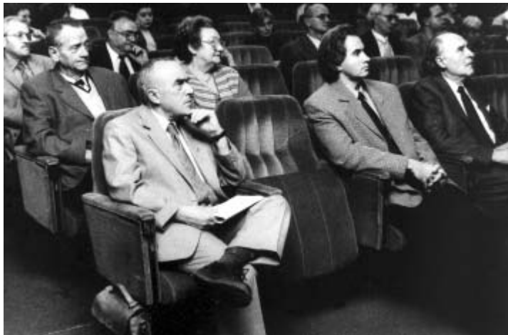
A kongresszus résztvevői

Demográfiai adatok azt mutatják, hogy az idősek aránya a magyar lakosságban nagyon magas, valamint azt, hogy ez az arány várhatóan tovább fog növekedni. Ez egybevág a klinikák, kórházi osztályok mindennapi tapasztalatával, és érthetően indokolja a gerontológiai és geriátriai ismeretek minél szélesebb körű terjesztésének szükségességét.