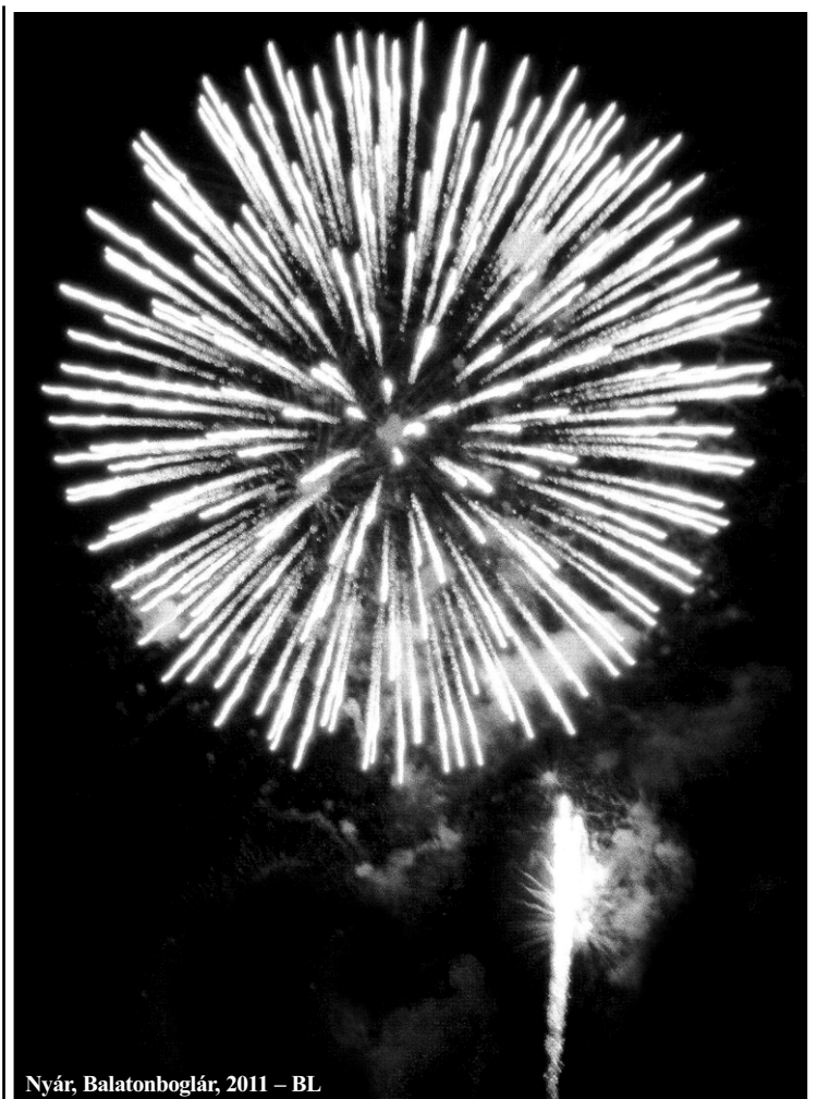
Nyár, Balatonboglár, 2011 – BL