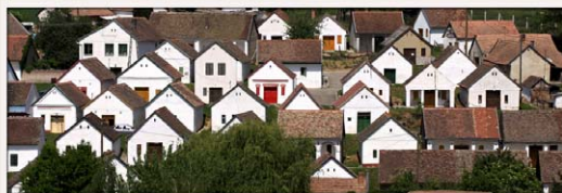
Tám László képei