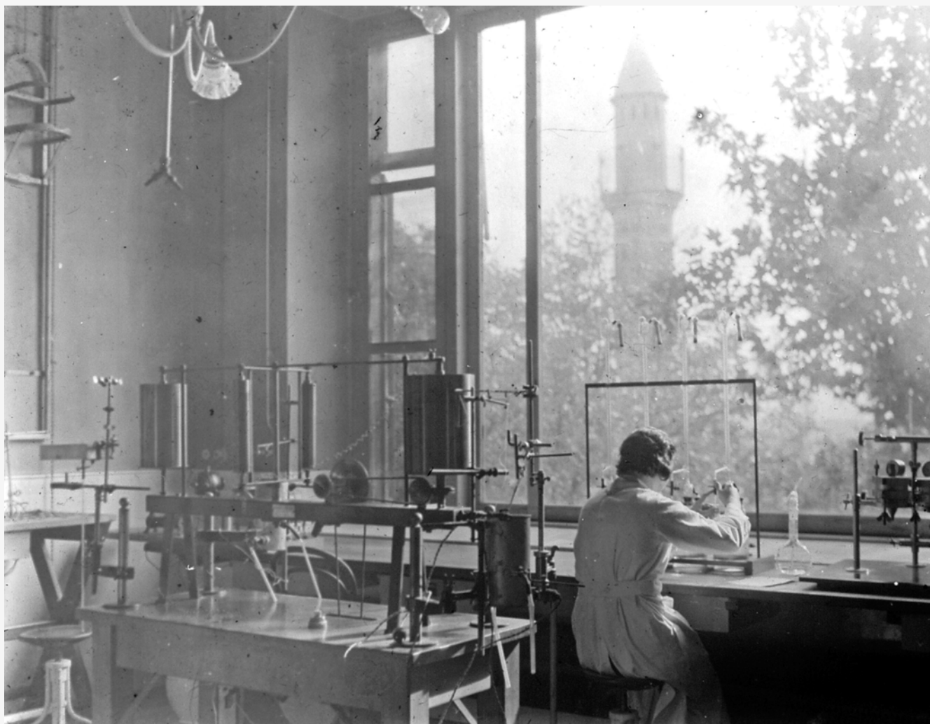
Az ablakon keresztül Jakováli Hasszán pasa dzsámija melletti minaret látható.