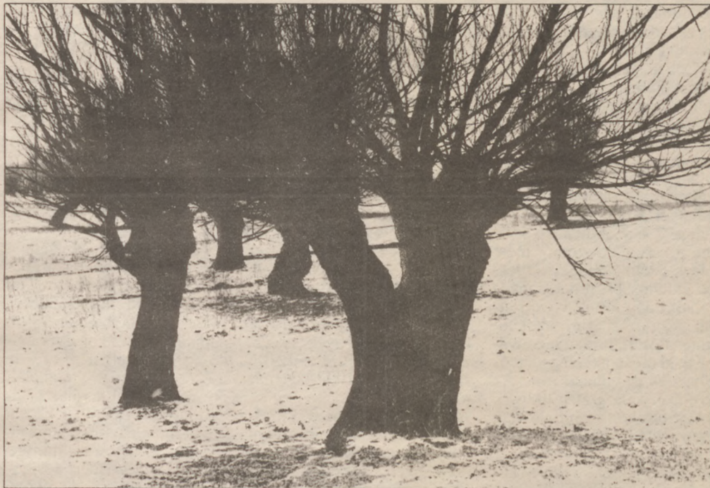
Konkoly Katalin: Fűzek télen