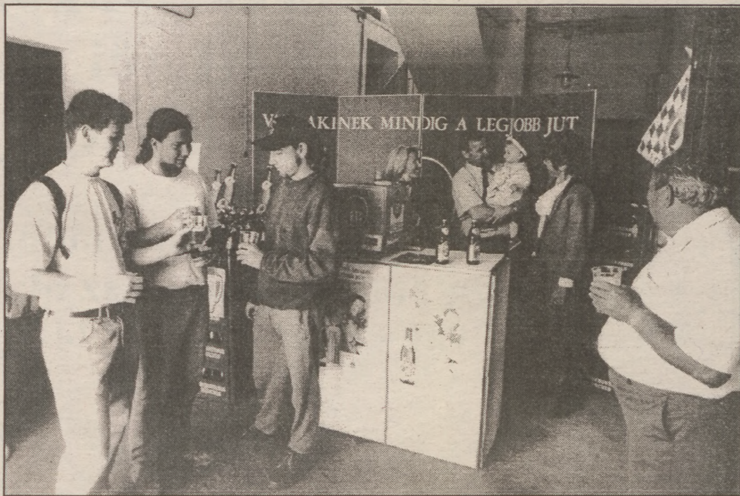
HB SÖRKÓSTOLÓ AZ AGORA-NAL

— A kirendeltség teljes kapacitásával várja a szezon. Elmondhatjuk, hogy biztosak vagyunk abban; a sörrelátásban nem lesz semmilyen fennakadás. Teljes termékkálánkkal folyamatosan állunk a fogyasztók rendelkezésére.