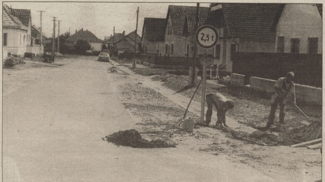
Kiscsávolyban a Karinty és Krúdy utcában elkészült a lakossági áldozatvállalással is épült útburkolat. A kivitelező a Strabag.