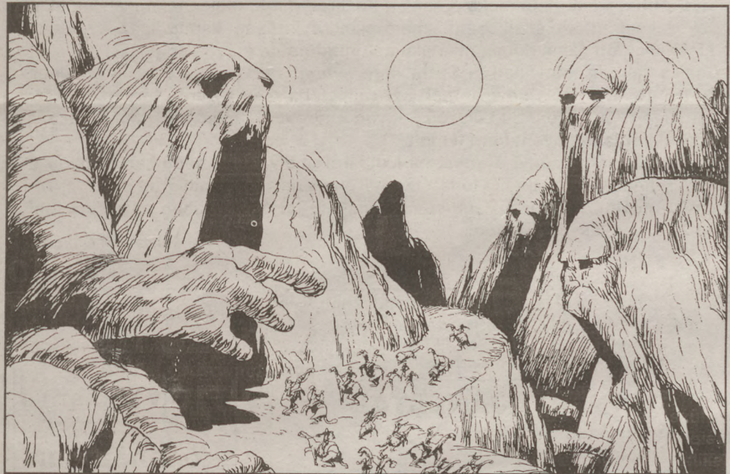
Philippe Druillet kábítószer ihlette grafikája

- Megváltozott az értékrendem. Egy anyagos nem tud kommunikálni. Óriási az egója. Nem törődik senkivel és semmivel. Zsibriken mindenkinek van egy mentora, aki meghallgatja, akivel megbeszélheti, ha úgy érzi nem bírja tovább. Másutt szétszedik az ember személyiségét és újra összerakják. Zsibriken mindenki maga irányítja a gyógyulását.