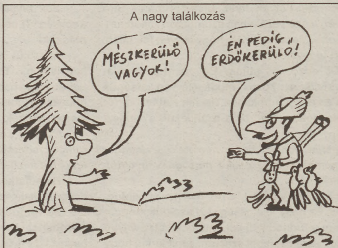
A nagy találkozás

Nyitva: H.-P. 8-17 óráig, SZO. 8-12 óráig.