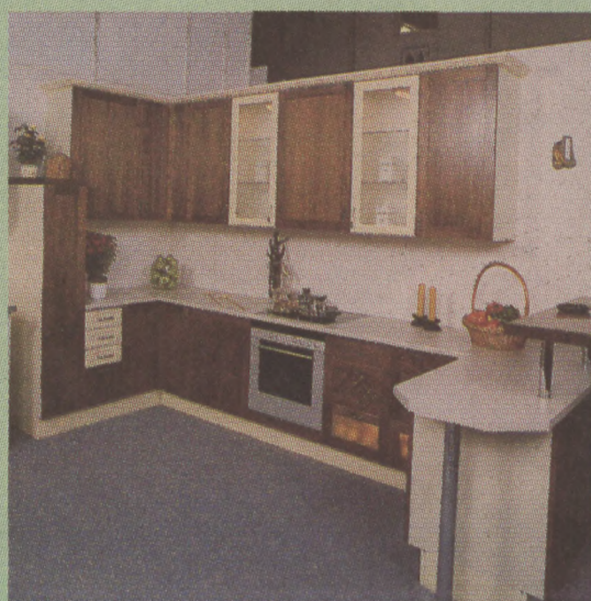
A Magdi fakeretes feketedió konyhabútor