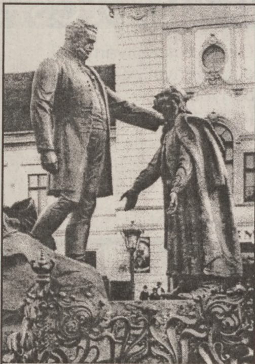
Fadrusz János 100 évvel ezelőtt készült Wesselényi-szobra a gróf szülőháza előtt Zilahon

A találkozóra mindenki ötlettel teli tallsollyal érkezett, s ezúttal már az álmodozás mezejéről a megvalósítható és jövőt ígérő elképzelések konkrétumainak megvitatására került sor.