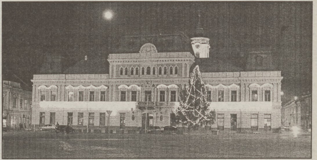
Ünnepi díszben a belváros. Ilyen szép még egyetlen évben sem volt a főtér és környéke.