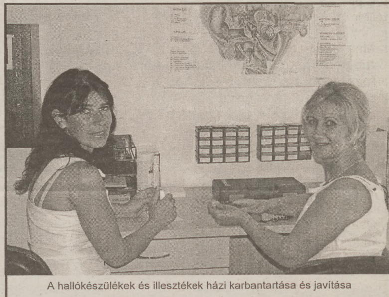
A hallókészülékek és illesztékek házi karbantartása és javítása

legmodernebb gépparkkal van ellátva. Ugyanis teljes körű tevékenységet végzünk. Szolgáltatásunk kiterjed ügyfeleink hallásának javítására, megfelelő hallókészülékkel való ellátására, majd a további-