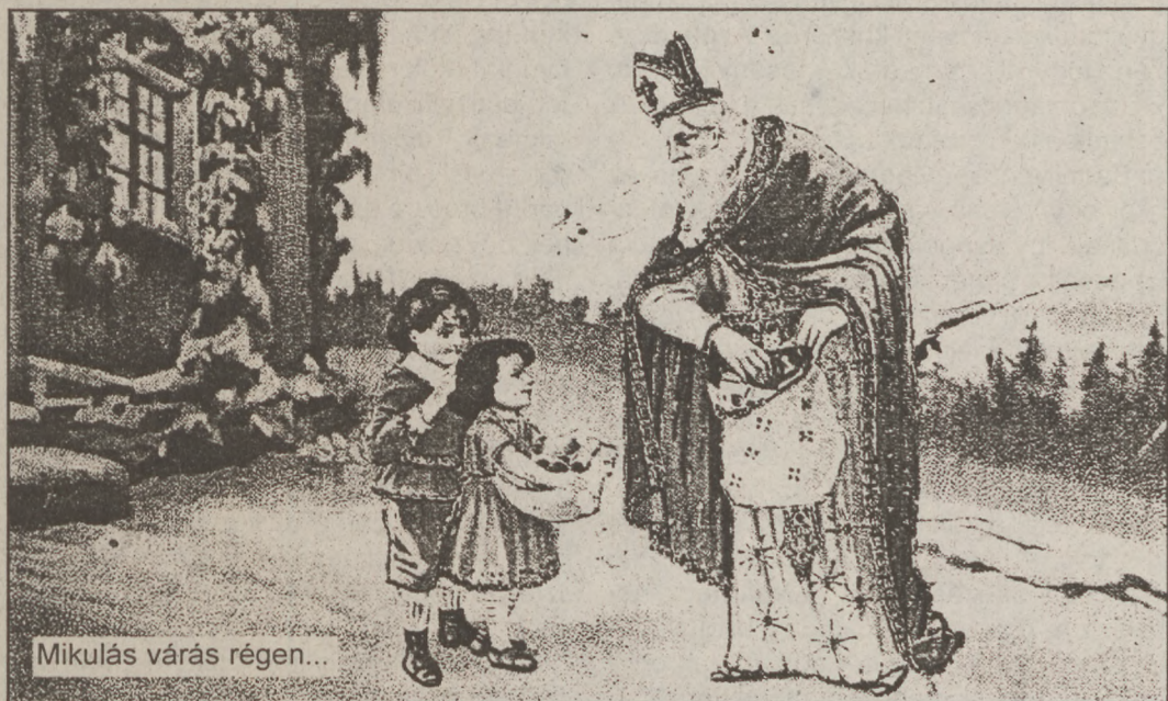
Mikulás várás régen...