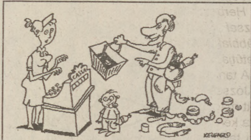
Bolti szarka - Csak egy doboz gyufa lesz a gyerekeknek!

A szeremlei körzeti megbízott elfogott néhány szeremlei személyt, akik a Dunafalva külterületén levő erdőből 2 köbméter akácfát loptak el, mely egy dunafalvi hölgy tulajdonát