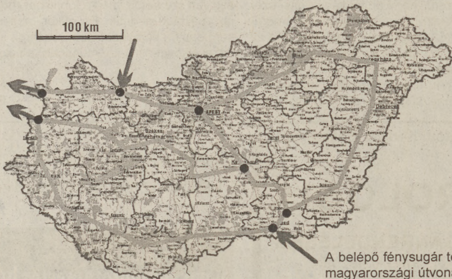
A belépő fényváltó tervezett magyarországi útvonala

Indiát, Pakisztánt, Iránt, Törökországot, Bulgáriát, Szerbiát, Magyarországot és Ausztriát érinti. A két sugár Németországban találkozik, majd továbbhalad Franciaországba, Belgiumba és Nagy-Britanniába, onnan pedig vissza Észak-Amerikába. A különleges fényváltóban bárki részt vehet, és bármilyen fényforrást használhat