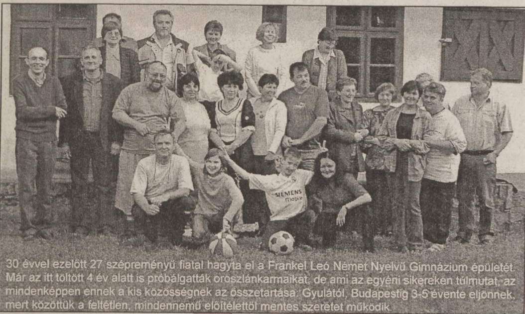
30 évvel ezelőtt 27 szépművészi fiatal hagyta el a Frankel Leó Német Nyelvű Gimnázium épületét. Már az itt töltött 4 év alatt is próbálgatták oroszánkarmikat, de ami az egyéni sikereken túlmutat, az mindenképpen ennek a kis közösségnek az összetartása: Gyulától, Budapestig 3-5 évente eljönnek, mert közöttük a feltétlen, mindenmú előítéletől mentes szeretet működik.