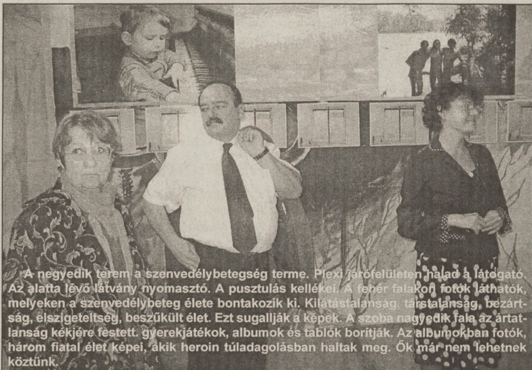
A negyedik terem a szenvedélybetegség terme. Plexi járőrfelületen halad a látogató. Az alatta lévő látvány nyomasztó. A pusztulás kellei. A fehér falakon fotók láthatók, melyeken a szenvedélybeteg élete bontakozik ki. Kifáradtság, társalanság, bezártság, elszigeteltség, beszűkült élet. Ezt sugallják a képek. A szoba negyedik fala az ártatlanság kéjére festett. Gyerekjátékok, albumok és tablók borítják. Az albumokban fotók, három fiatal élet képei, akik heroin túladagolásban haltak meg. Ők már nem lehetnek köztünk.