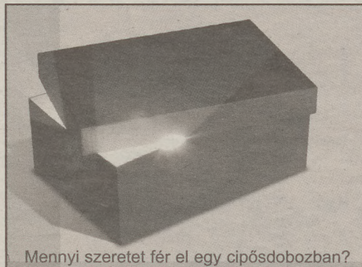
Mennyi szeretet fér el egy cipősdobozban?

2005 karácsonyán 14 ezer cipősdoboz ajándék talált gazdára olyan rászoruló családok gyermekeinek, akik közül sokak számára tán semmilyen más ajándékot nem tehettek volna a fenyőfa alá. A Baptista Szeretetszolgálat ebben az évben újra meghirdeti karácsonyi akcióját, a "10.000 Gyermekek Karácsonyát". E mozgalom alapfogalma szerint gyermekek vagy egész családok készítenek ajándékot rászoruló gyermekeknek. A Baptista Szeretetszolgálat ebben az évben sok tízezer nehéz sorsú gyermek megajándékozásához várja a magyar emberek segítségét! Reméljük minél többen csatlakoznak kezdeményezésünkhöz, hogy a karácsony valóban ünnep lehessen minden gyermek számára.