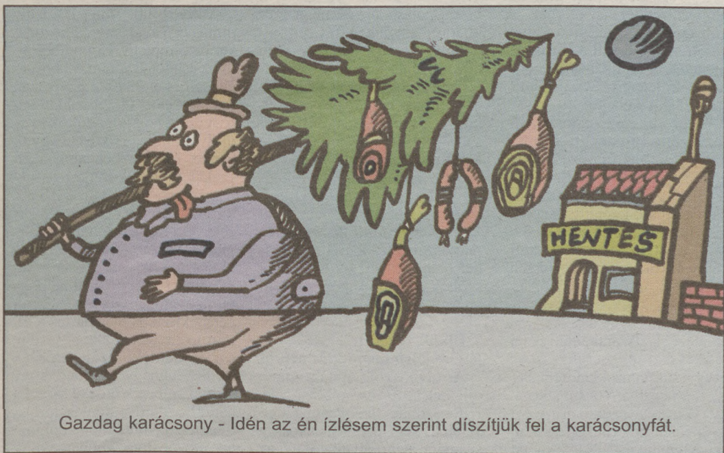
Gazdag karácsony - Idén az én ízlésem szerint díszítjük fel a karácsonyfát.