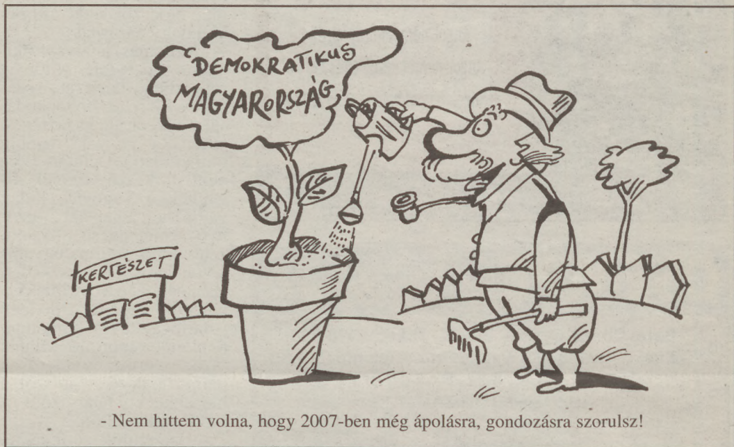
- Nem hittem volna, hogy 2007-ben még ápolásra, gondozásra szorulsz!

* Az esemény menetét elég jól mutatja a következő két híradás: http://uno.hu/news/story/235775/ és http://www.petoji-nepe.hu/index.php?apps=cikk&d=2007-02-14&r=1&c=578625