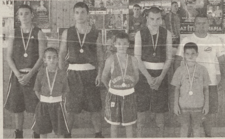
Talán majd egyszer őket is megsegíti valaki.