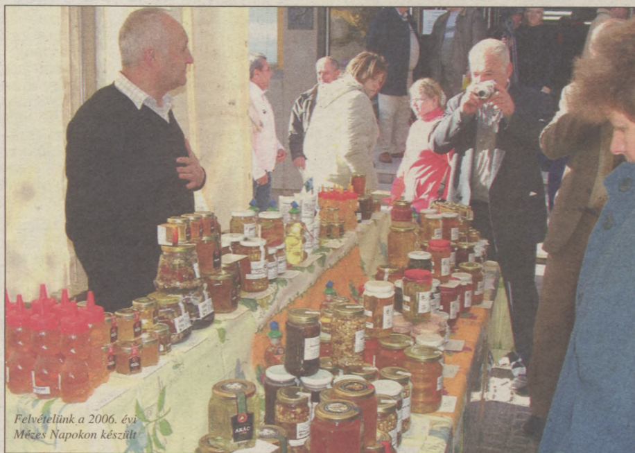
Felvetelünk a 2006. évi Mézes Napokon készült

A rendezvény ideje alatt adják át az október 27-i Méz és Méhészeti Termékverseny díjait, illetve a Mézes Süte-