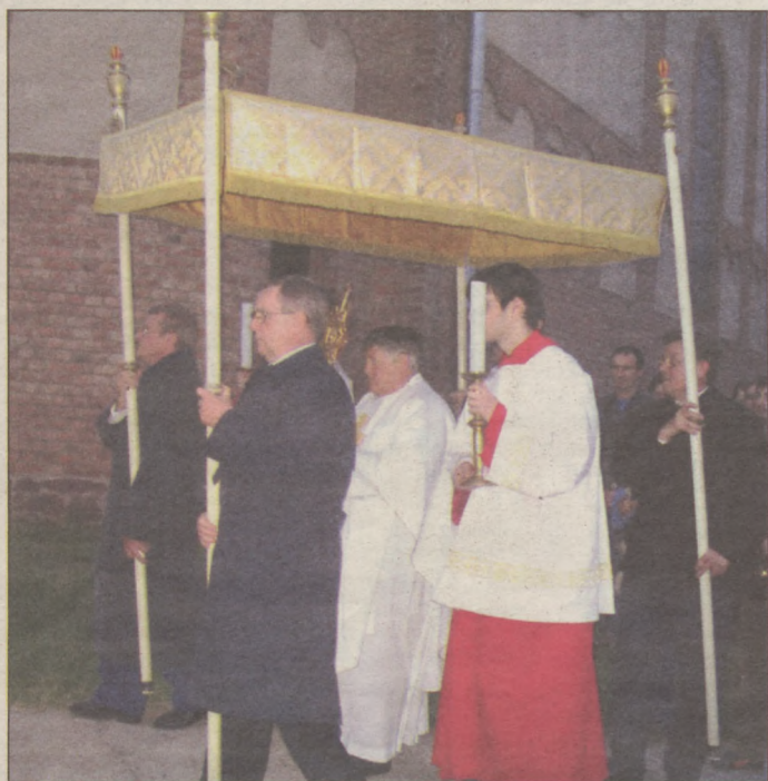
A felvétel a Baja-kiscsávolyi templom (Szent Szív Plébánia) virágvasárnapi körmenetén készült.

Nagypéntek, Jézus kereszthalálának napja gyászünnep. Az emberek a helységek szélén lé-