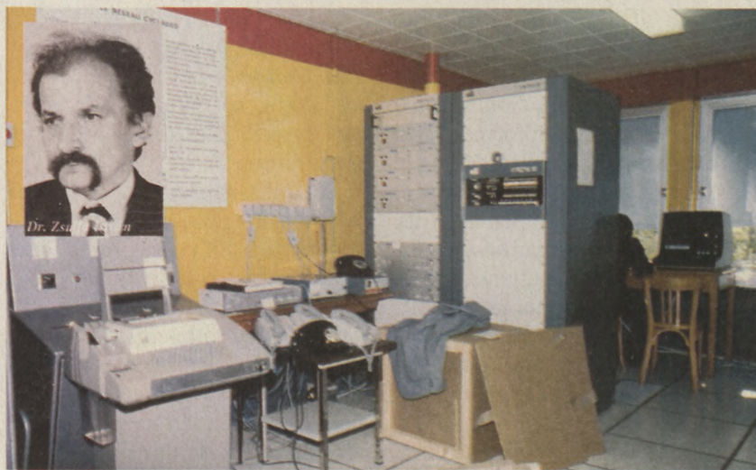
Fotónkon a '70-es évek komputerét, a francia MITRA 15 gép alapján elkészített bajai R10 számítóközpont gépeit láthatjuk.