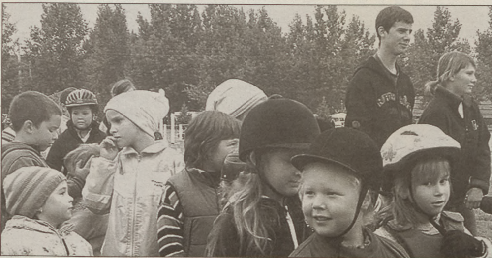
Van, amikor igazából a részvétel a fontos. De az nagyom ám!

pat): 1. Nyerők, 2. Vad-fruttik, 3. Szörpöt ször-csölök, 4. Kalocsa, 5. Menő manók, 6. Hókuszpókók.