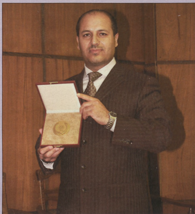
Dr. Khaled Nashwan az ENSZ nagydíjával.

megoldására úgy tűnt, hogy nem maradt más, mint az amputáció. A sikeres keresés után talált rá a Nashwan-ParasoundPlus eljárással foglalkozó rendelőre, ahol 20 kezelés után kezdett fényt látni az alagút végén. Járástávolsága mára 1500 méterre javult, az otthoni lépcsőkorlátokra már nincs szükség, a kínzó éjszakai fájdalmaknak vége. Lányja újra örülhet édesanyja mosolyának. Elengedhetetlenül fontos időben felfedezni az érszűkület tüneteit és minél hamarabb szakemberhez fordulni, de még fontosabb a megelőzés. Figyelmeztető jelek lehetnek, ha nyugalomban vagy terhelésre mással nem magyarázható végtagi fájdalom jelentkezik, ha olyan tünetek jelentkeznek, mint pl. a járástávolság csökkenése, sápadt-hideg végtag, a végtag(ok) zsibbadtsága, férfiaknál szexuális zavarok, fejfájás, fülzúgás, szédülés és fáradékonyság. Az érszűkület kialakulásában kockázati tényezőket jelent a dohányzás, a