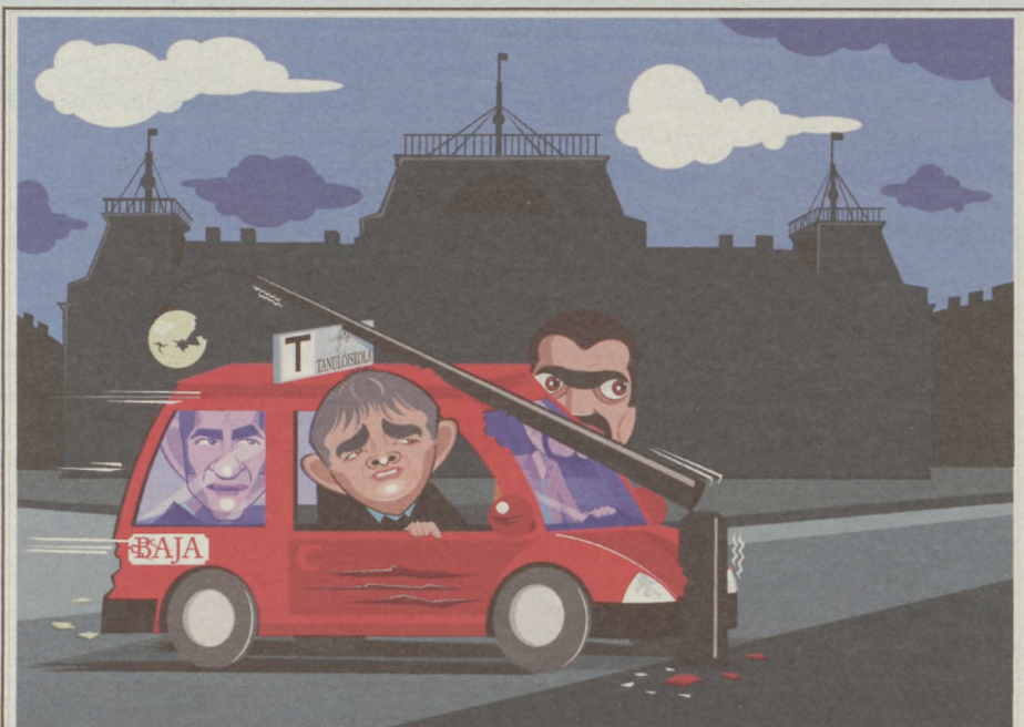
ÖN ILYEN "VEZETŐKRŐL" ÁLMODOTT? UGYE NEM...

Tisztelettel: az érintett lakóközösség 25 tagjának aláírása