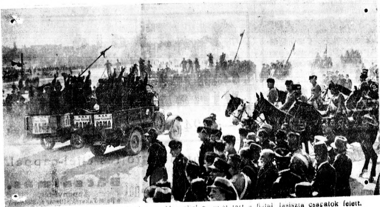
Készülődés a haborura Olaszországban. Muszolini szemétt tart a fiatal fasiszta csapatok felett.