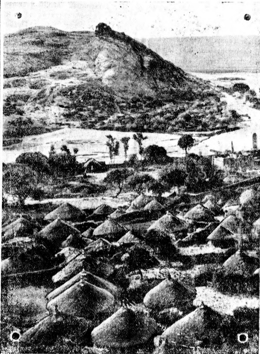
Teljes az „első lépcsők” elfoglalása. Képünk Akszum városát ábrázolja, amelyet az olaszok elfoglaltak

A déli arcvonalon az olaszok két irányban nyomulnak előre. Egyik oszlopuk Dolo-Jetből kiindulva, a Ganele-Doria folyó felé, a másik pedig Galual és Gorrabai-ból kiindulva, Szasz-Baleh felé nyomulnak előre. Az Uualaltól északra fekvő Adot elfoglalták az olasz csapatok.