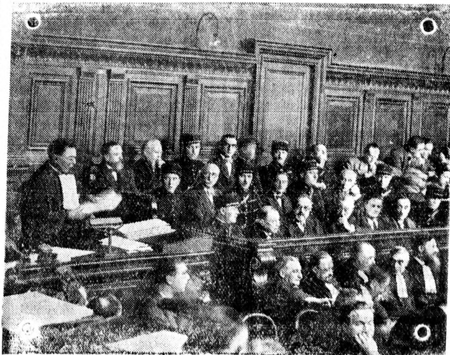
A Stavisky-pör főtárgyaláson a tanúk egész seregét hangtatták ki

Romagninó további felvilágosításokat nem tudott adni, mert ugyanaznap este elbucszott tőle Stavisky és a további eseményekről már csak az újságokból értesült.