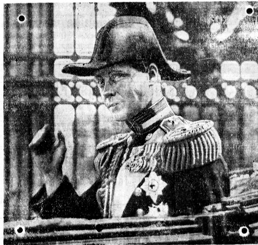
VIII. Edward, az új angol király.

Abesszínia középső részében szerdán megkezdődött a kis esős